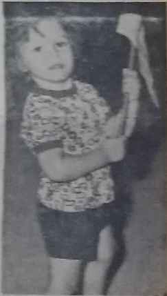
Όμαδος μικρών διατήρησαν, ο- γάλων πόλων. Πήραμε το κύπε- λλο. Τι είναι το ανταμάλω. Ο έ- παιχτων στην ομάδα οι παύτες του ΠΑΟΚ.