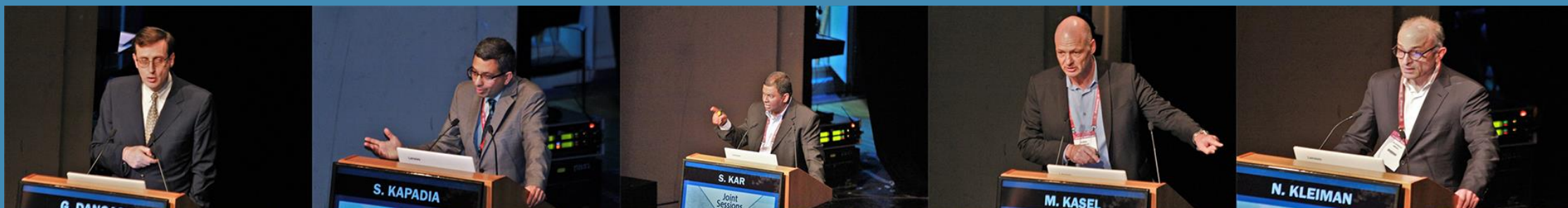
Last Year Speakers (2019)

Το φετινό THV Greece 2020 θα πλαισιώνουν διακεκριμένοι ομιλητές από το εξωτερικό.